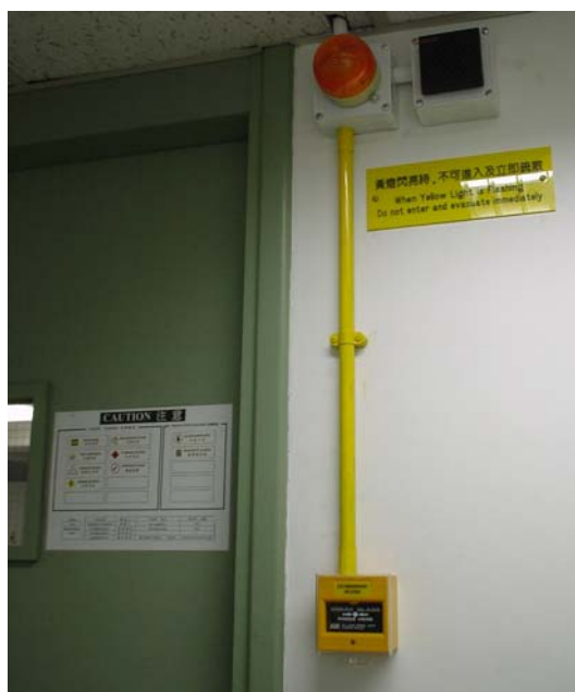
緊急排風警報安裝在實驗室入口旁